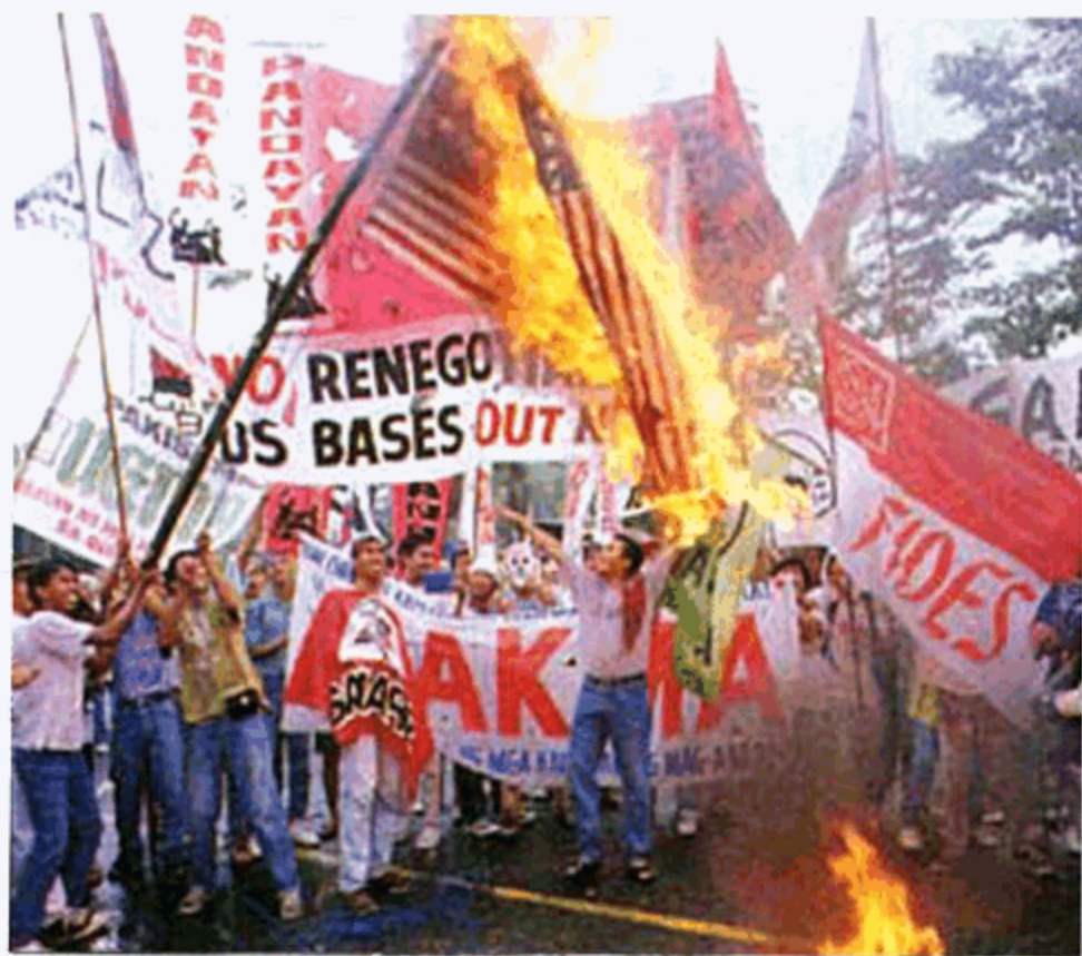
در فلپین غیر از آتش مبارزه مسلحانه، نریو تظاهرات ضد امریکایی روز تا روز قدرت کسب میکند.

نمیدانیم بنیادگرایان چه اراجیفی در توجیه این طرد شدن بیسابقه شان از سوی توده‌ها ارائه میکنند، لیکن جواب دیگران به آن سوال ساده و سهل است: پوزه احزاب دینی در پاکستان ۱۲۰ ملیونی به خاک مالیده شد زیرا مردم آن مثل تمامی کشور های مسلمان یکبار به اسلام رو آورده اند و در نظر ندارند سر از نو دین خود را بیاموزند یا به دین جدیدی بگرایند. بناءً مطرح گردیدن احزاب دینی را در عرصه