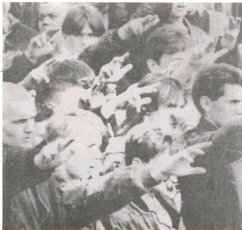
جوانان نازی در اجتماعی در برسدن آلمان • ۱۹۹۱

پاستور نیمولر رئیس کلیسای پروتستان آلمان که مخالف هیتلر بود در بازداشتگاهی سرود: