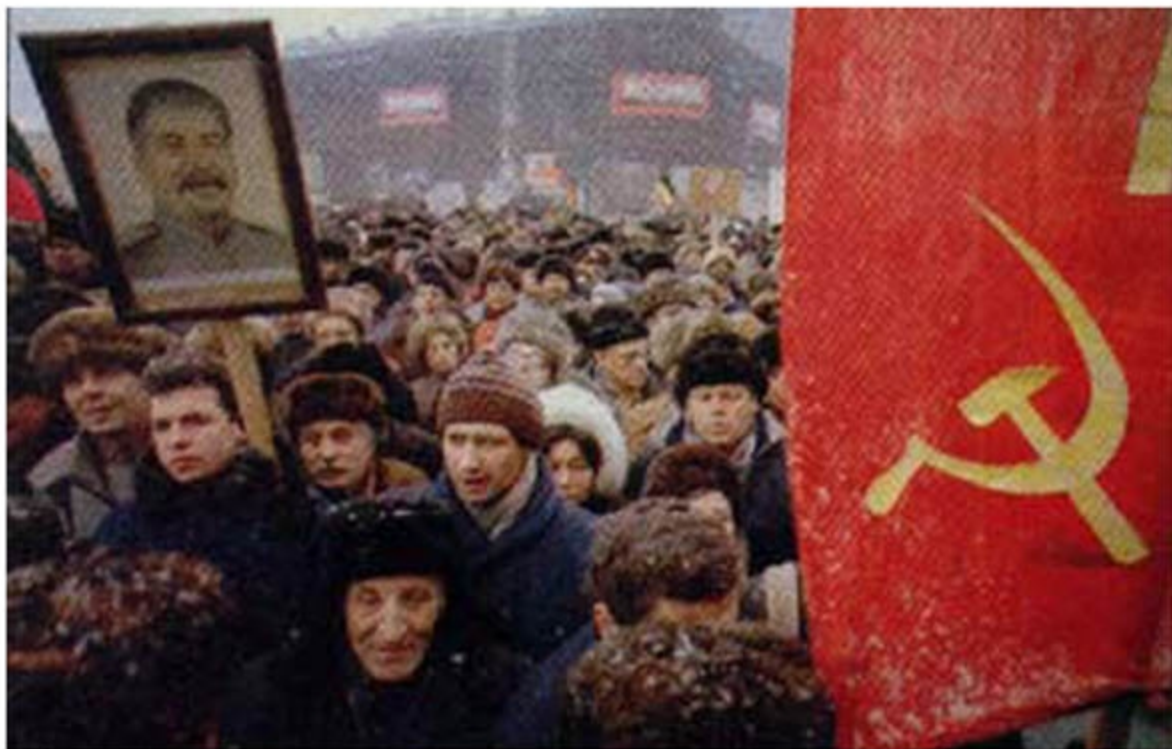
روسها پنجاهمین سالگرد پیروزی شوروی در جنگ دوم را در ولگوگراد (استالینگراد سابق) برگزار کردند، جنوری ۱۹۹۳.