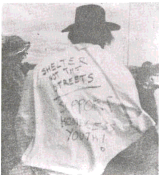
در استرالیا دهها هزار نفر از بیکاری و سی‌خانگی رنج میبرند

از ۲۵۰ میلیون جمعیت امریکا، حدود ۹ میلیون نفر از نیروی کار آن بیکار است، یک نفر از هر ۱۰ نفر امریکایی غذای بخور نمبر دارد، ۴۵٪ کودکان سیاه و ۳۹٪ کودکان اسپانیایی آن در فقر زندگی میکنند.