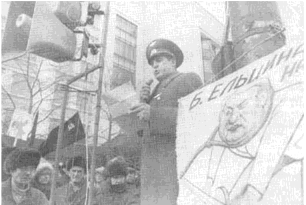
يك افسر بالا رتبه حين قرائت بيانيمای برای طرفداران کمونيزم در خارج پارلمان در مسکو، مارچ ۱۹۹۳.

انقلابی و ۰۰۰ مینهند و بعد به مناسبت جشن فرو ریختن آنها دیوانه وار میرقصند. مارکسیستهای انقلابی انحراف ایدئولوژیک مهلك احزاب شوروی و اروپای شرقی را مدتها قبل درك کرده و مبارزهای پیگیر علیه آن را از یاد نبرده بودند. چسپیدن بنیادگرایان وطنی و شرکاً به مشخصاً کار و سرنوشت احزاب وطنفروش پرچم و خلق نیز به معنای بلند کردن سنگی است که فرق خود شانرا متلاشی میسازد.