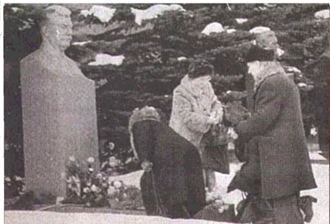
زنی دهقان در کنار آرامگاه استالین به مناسبت بزرگداشت چهلین سال درگذشت وی در مسکو، ۶ مارچ ۱۹۹۳

همین سان است وضع در پولند، رومانیه و دیگر کشورهای شرق اروپا. هیچ ماهی نیست که نمایشات کارگران، شهرهای مهم این کشورها را به لرزه درنیآورد.