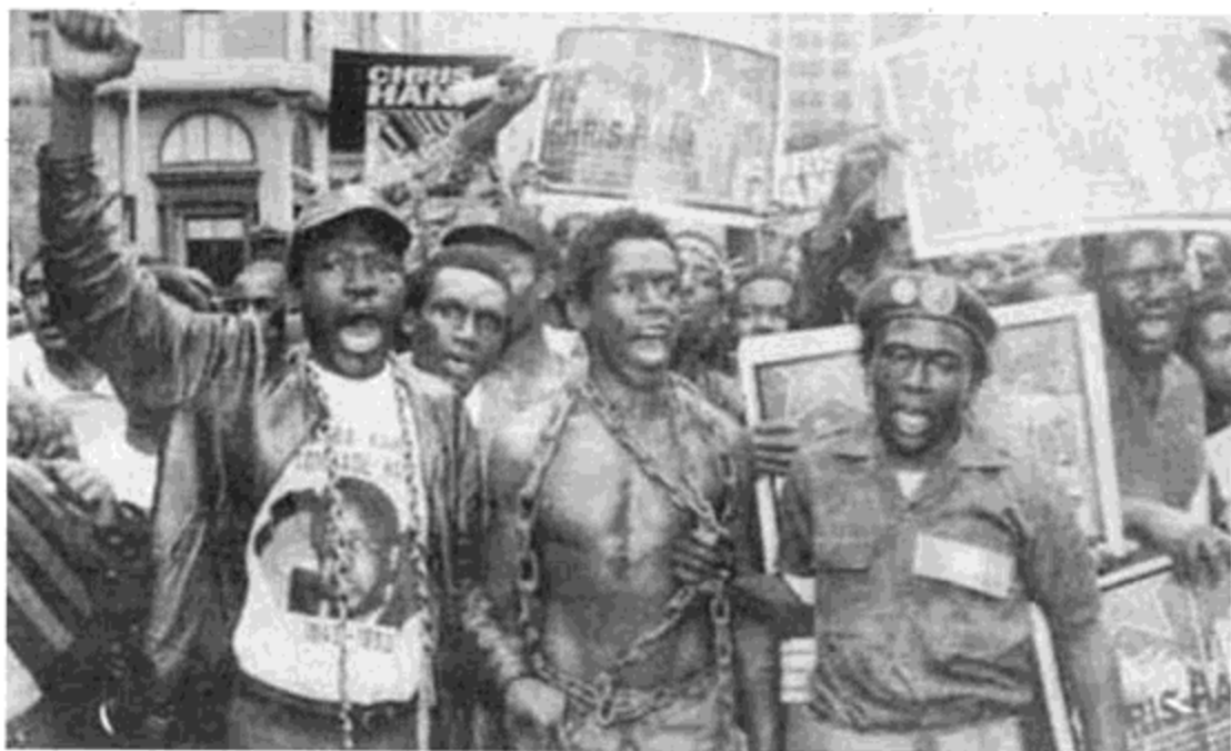
طرفداران "کنگره ملی افریقا" در راهپیمایی بخاطر ابراز خشم و اعتراض نسبت به قتل کریس هانی، اپریل ۱۹۹۳.

جرقه‌های مبارزه مسلحانهی انقلابی توسط تعدادی از سازمانها بر چندین نقطه هندوستان بالاست و سایر مارکسیست‌های متشکل نیز قدرت مهمی را در کارزار سیاست آن کشور تشکیل میدهند.