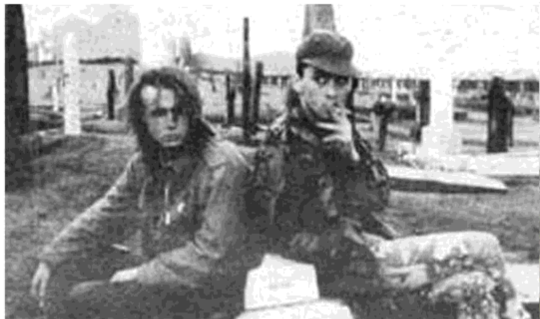
جوانان امید باخته و بی خانه در انگلستان

از طرف دیگر ایده‌های سوسیالیستی، دگم‌های جامد نیستند و همپای پیشرفت و تکامل انسان در هر زمینه‌ای، باید تکامل یافته و در پرتو شرایط مشخصی جوامع معین به کار بسته شوند. برخوردار و